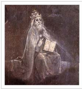
VALENTIN TOMBERG DER VATERUNSER-KURS